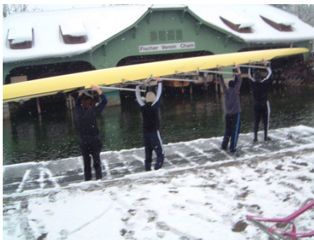
sorgfältig, langsam über Ponton hinab, nicht stossen!