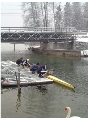
Rücken schonen....in die Knie! Ruder einsetzen.