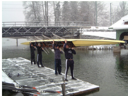
Boot auf Oberschenkel...und... ab!