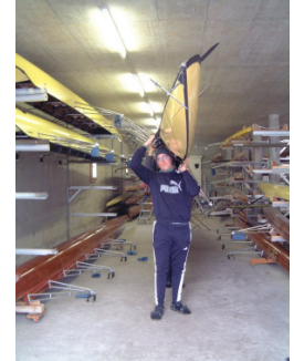
Achtung... Ausleger! gerade hinauslaufen!