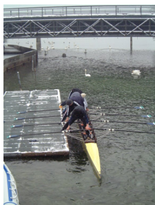
linker Fuss auf Stehbrett! Bereit? .....und ....weg!