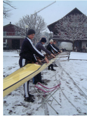
ans Boot...gestreckte Arme...und....hoch!