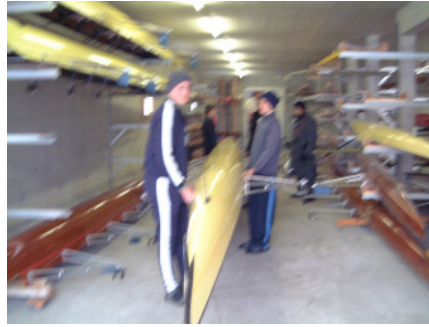
Boot langsam auf Schulter links!... und.....auf! Achtung auf Ausleger!