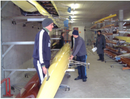
Ans Boot.....bereit?...und auf! sorgfältig herausnehmen!