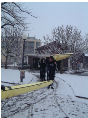
Tragart Schulter links...