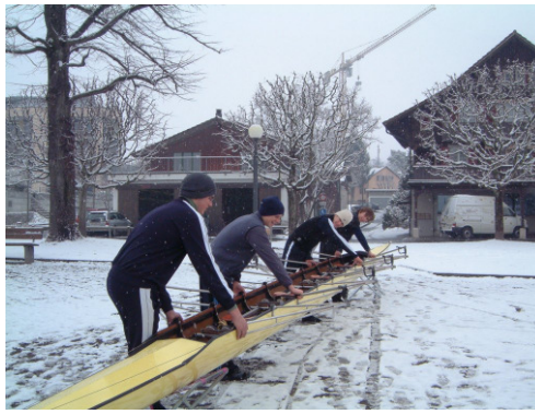
Boot in Böcke.....links.....ab! Stembrett einstellen, Rollsitz Kontrolle