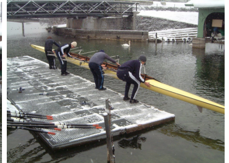
Fuss-Spitzen nicht über Pontonrand! Boot.....ab!