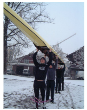
eventuell nach Größe einstehen, geht besser